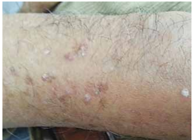
Figura 3. Pápulas queratósicas eritematosas descamativas en el brazo izquierdo, algunas confluyen y forman placas.

con centro crateriforme, que confluyen para formar placas de aspecto verrugoso. El curso es habitualmente crónico y puede resolverse dejando cicatrices. La respuesta al tratamiento es variable y tiende a la recurrencia. 4