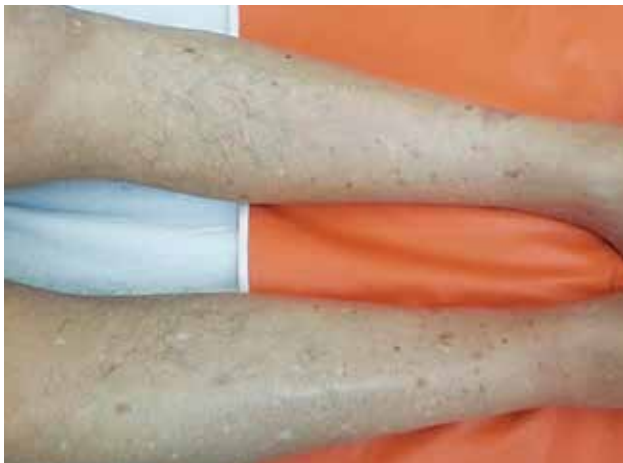
Figura 1. Placas y pápulas queratósicas en la cara anterior de ambas piernas.