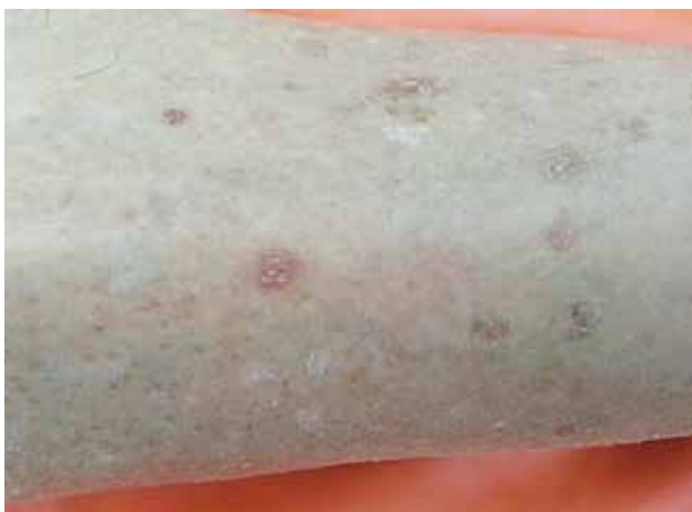
Figura 2. Pápulas queratósicas eritematovioláceas en la cara anterior de la pierna izquierda.

Por las características clínicas e histopatológicas del paciente presentado, se concluye que este caso clínico corresponde a una enfermedad de Kyrle.